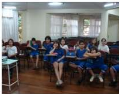
Aulas especiais de astronomia, astronáutica e energia.